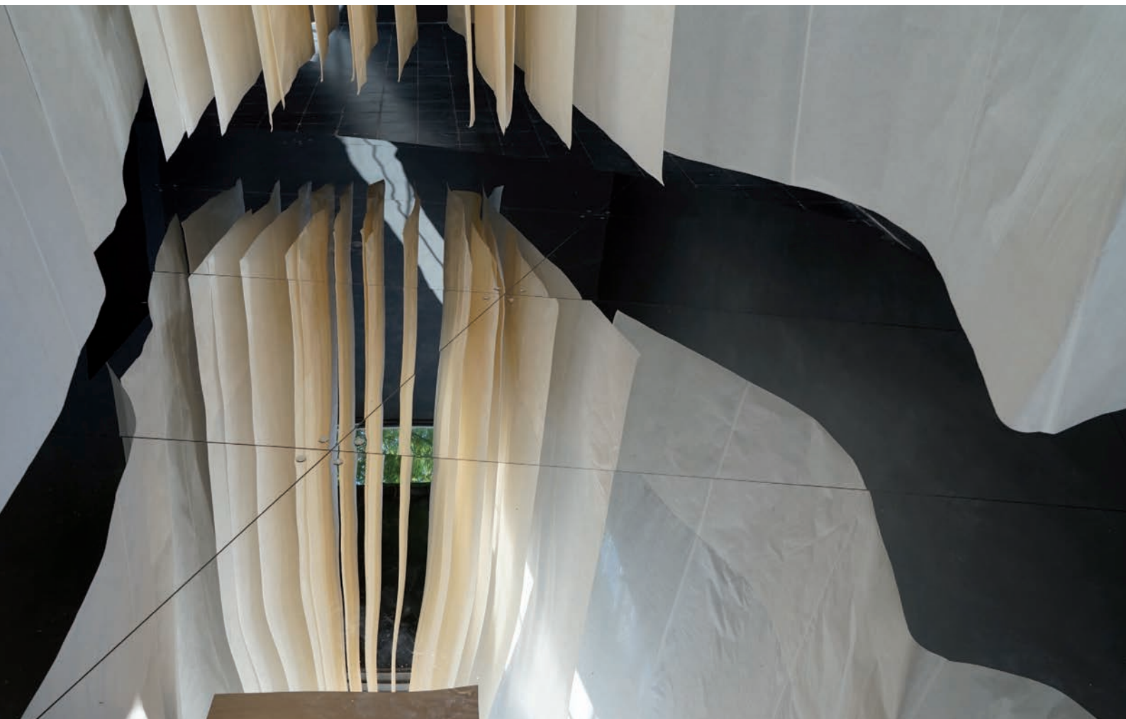
Die drei Installationen im österreichischen Pavillon vereinen sich zu einer gemeinsamen Aussage – atmosphärisch dicht, intellektuell anregend und räumlich vielfältig.