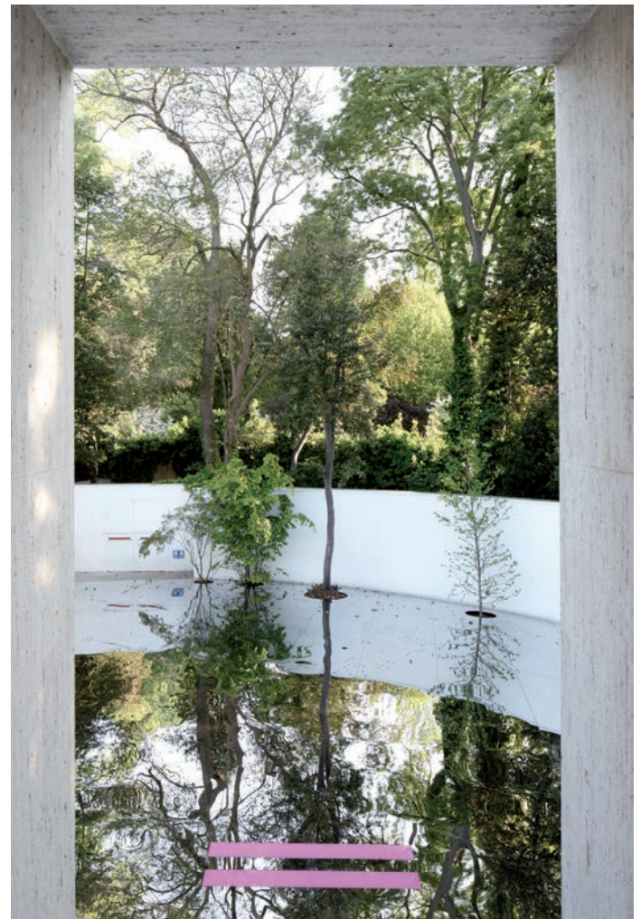
Die spiegelnde Sphäre von LAAC ist das Element, das alles zusammenhält. Gleichzeitig bricht das forschende Architekturteam damit die strenge Symmetrie des Pavillons auf und bietet einen gemeinsamen Grund für die beiden anderen Projekte.

essieren. Da kommt es nicht darauf an, woher jemand stammt. Für mich war die entscheidende Frage: Wie können diese Teams zusammenarbeiten?»